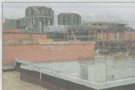
In Brünnen sollen Wohnungen für 2600 Menschen entstehen.

Durch die S-Bahn-Haltestelle und das Tram Bern West wird Brünnen mit der Innenstadt verbunden sein. Der Bahnhof wird im Oktober 2008 in Betrieb genommen und der Zug im 15-Minuten-Takt verkehren. Das Tram soll ab 2010 fahren und Brünnen alle sechs Minuten bedienen. Bis dahin verkehrt der 14er-Bus. nch