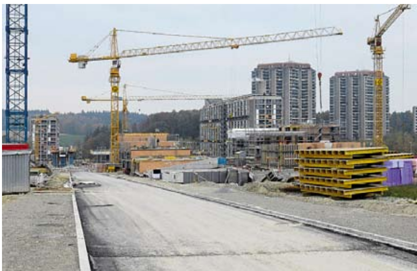
Unter den Fenstern des Holenackers und Gäbelbachs: Wohnungsbau an der Quartierachse Gigonweg in Brünnen.

Was im Westen Berns derzeit vor sich geht, ist ausserordentlich. Daran liess gestern niemand einen Zweifel aufkommen. «Die komplette Neuerstellung eines Quartiers ist für Bern – und auch schweizweit, wenn nicht sogar europaweit – kein alltägliches Ereignis», sagte die Berner Tiefbaudirektorin Regula Rytz (gb). Eine solche Grossbaustelle sei