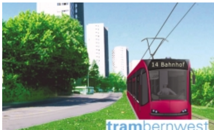
Bald einmal wird das Tram Bern West hier vorbeikommen und bis Brünnen weitergezogen.

Das Tram Bern West ist ein Pionierprojekt für die Schweiz. Es ist eines der ersten Vorhaben, das im Rahmen der Agglomerationsfinanzierung des Bundes umgesetzt werden kann. Von den 108 Millionen Franken für die Tram-Infrastruktur übernimmt der Bund 42 Prozent. Der Kanton Bern trägt die restlichen 58 Prozent – vorausgesetzt, der Grosse Rat bewilligt im Frühling 2003 den Kredit. Voraussichtlich nächsten Herbst entscheidet dann die Stadt Bern über ihren Finanzierungsbeitrag. Dieser beschränkt sich auf Kosten für gestalterische Anpassungen, Strassenbau und Werkleitungen. ●