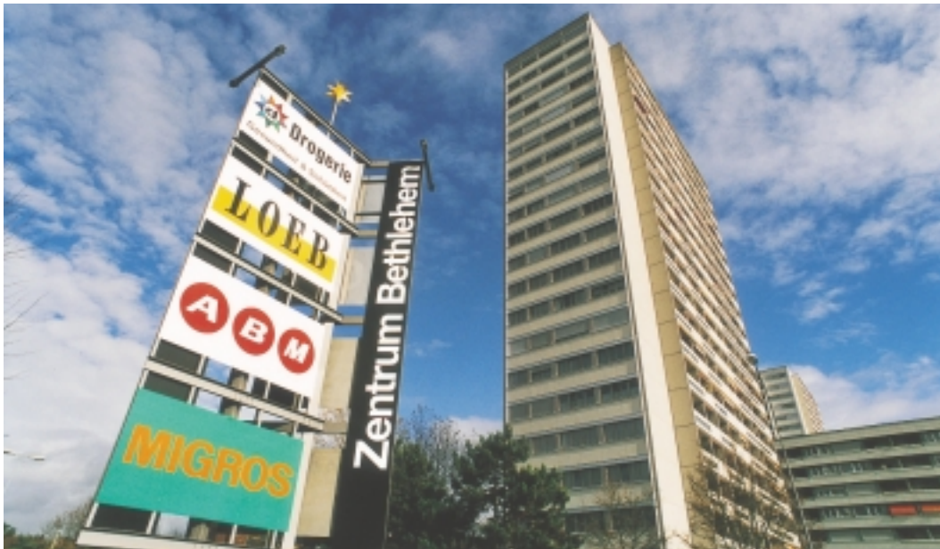
Noch stehen das Tscharnergut und des Zentrum Bethlehem am Stadtrand. Nahe von hier läuft bald das Baubewilligungsverfahren für das Baufeld 6, der Wohnüberbauung Brünnen.

Im Laufe des nächsten Jahres finden die Verhandlungen mit den Kaufinteressenten und Kaufinteressentinnen statt. Sobald die Verträge unterzeichnet sind, können für die in die 1. Bauetappe eingeteilten Baufelder die Architekturwettbewerbe ausgeschrieben werden. In dieser 1. Etappe befinden sich auch zwei Baufelder der