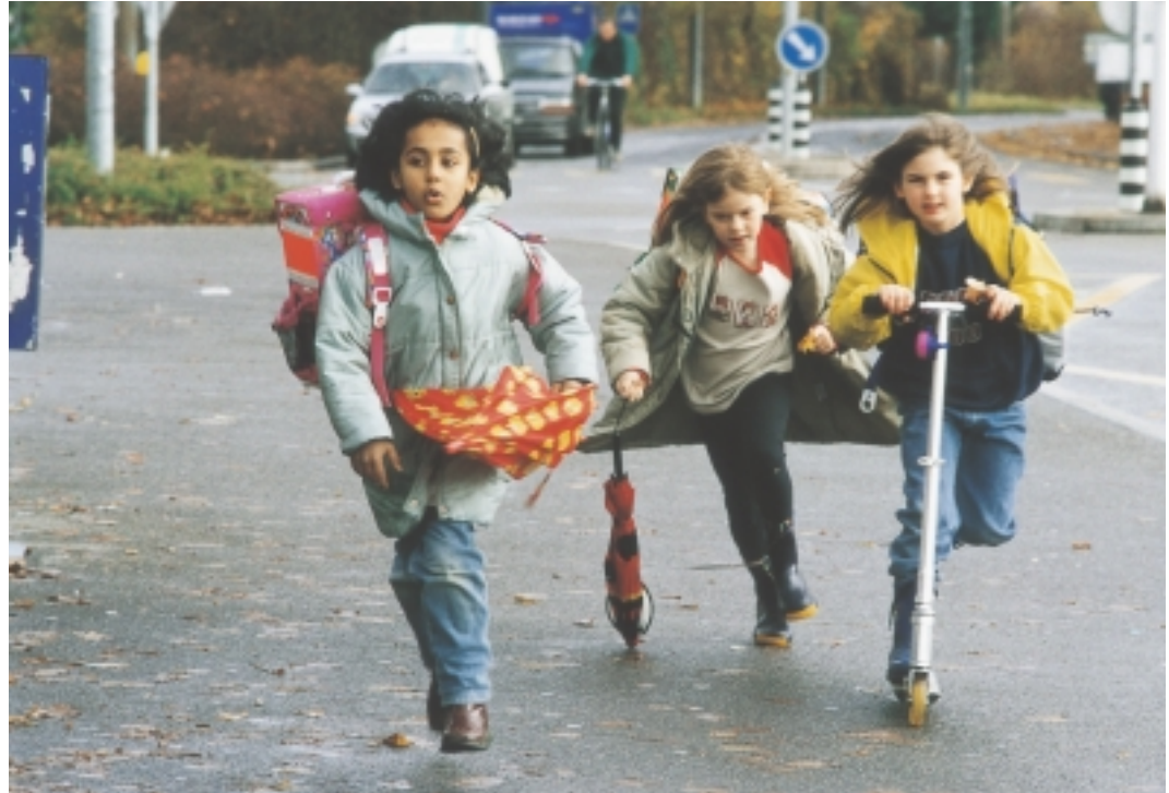
In Brünnen wird Umweltqualität gross geschrieben – im Interesse der kommenden Generation. Hier Kinder im Gäbelbachquartier.

Es ist kein Geheimnis, dass vor allem das Projekt WESTside in Brünnen mehr motorisierten Verkehr anziehen wird. Dies trotz der sehr guten Erschliessung durch den öffentlichen Verkehr (siehe nebenstehenden Artikel zum Tram Bern West) und den