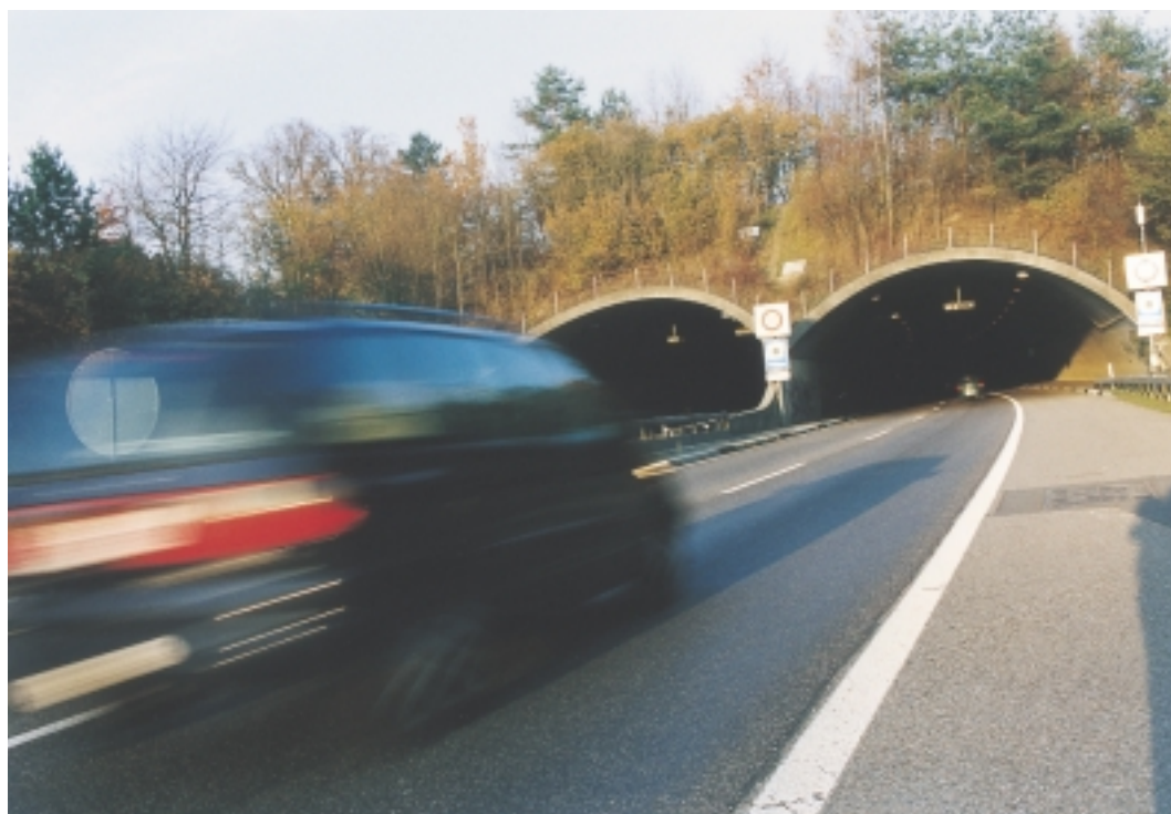
Noch zieht die A1 offen übers Brünnen-Gelände. Ab nächstem Jahr werden 500 Meter überdeckt.