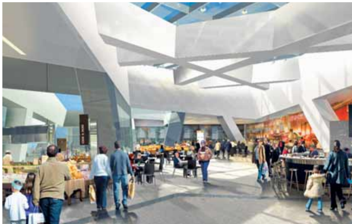
Der WESTside Food-Court bietet Gaumenfreuden für jedes Budget.

Mit WESTside investiert die Migros in ein weiteres Grossprojekt im Raum Bern. Bereits der Gurten-Park im Grünen, das Time-out in Ostermundigen wie auch der Golfpark Moossee sind Angebote, mit welchen die Migros wesentlich zur Schaffung von attraktiven Freizeit- und Erholungsangeboten in der Region Bern beiträgt. WESTside wird zum Juwel im Westen von Bern, mit Ausstrahlungskraft weit über die Landesgrenzen hinweg. ●