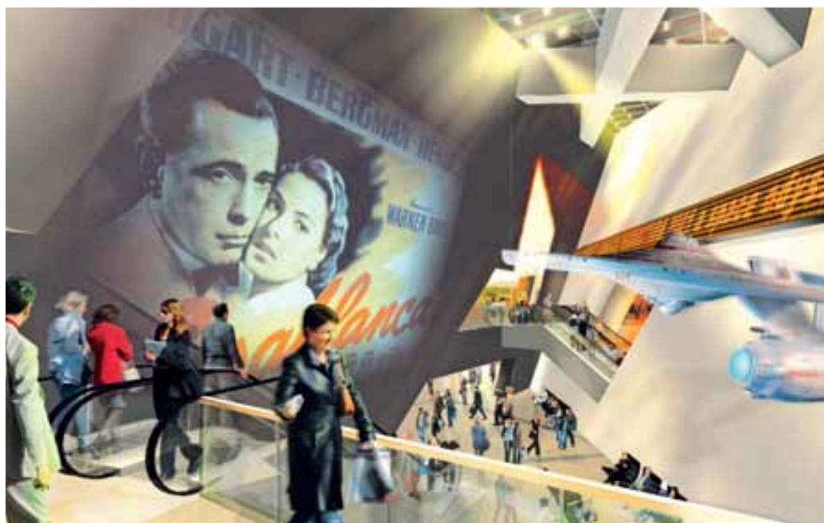
Im Multiplexkino mit seinen zehn Vorführsälen kommt Jung und Alt auf seine Rechnung.