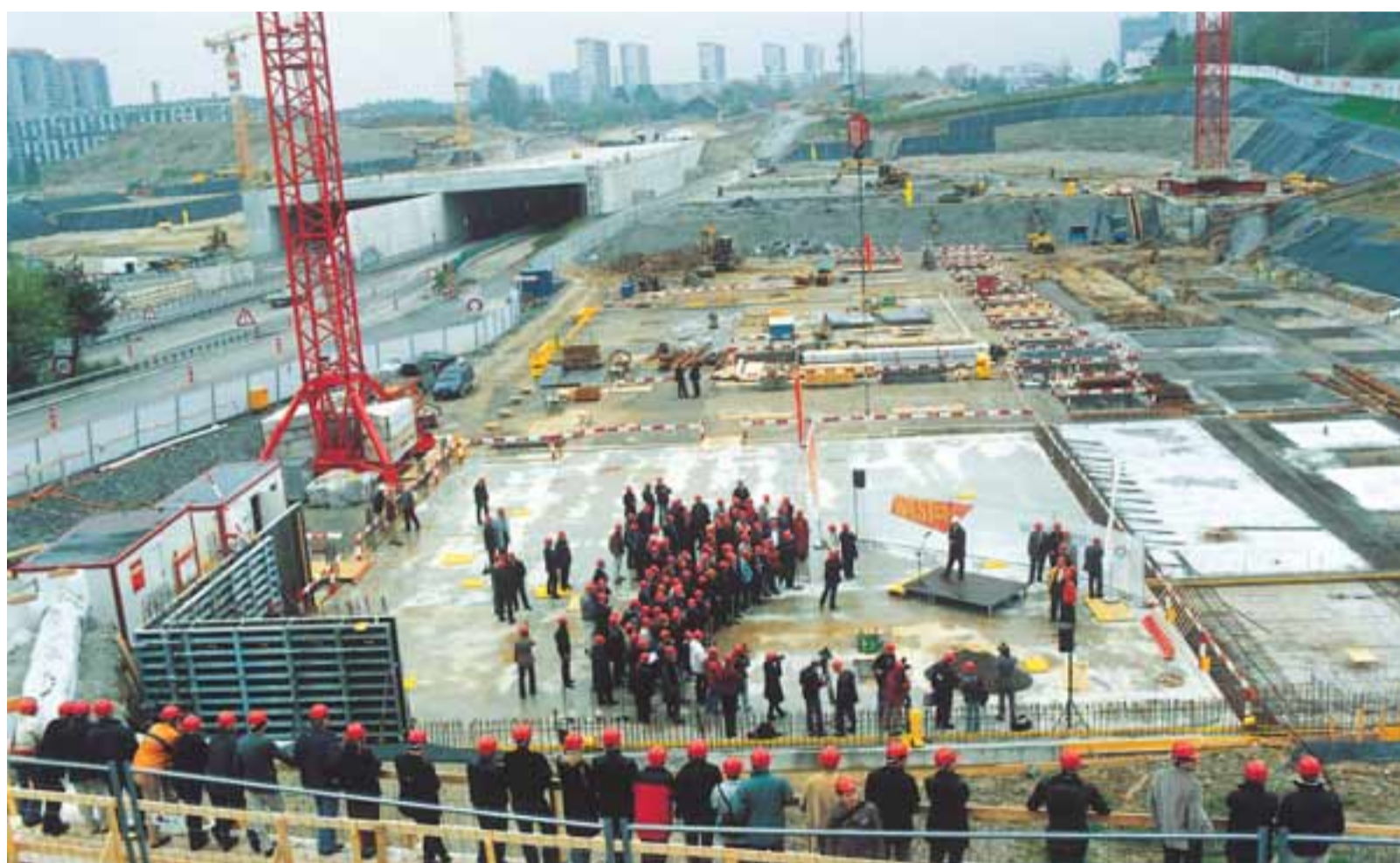
Mit der Grundsteinlegung für das Freizeit- und Einkaufszentrum WESTside haben in Brünnen die ersten Hochbauarbeiten begonnen.

Regula Rytz, Gemeinderätin für Tiefbau, Verkehr und Stadtgrün