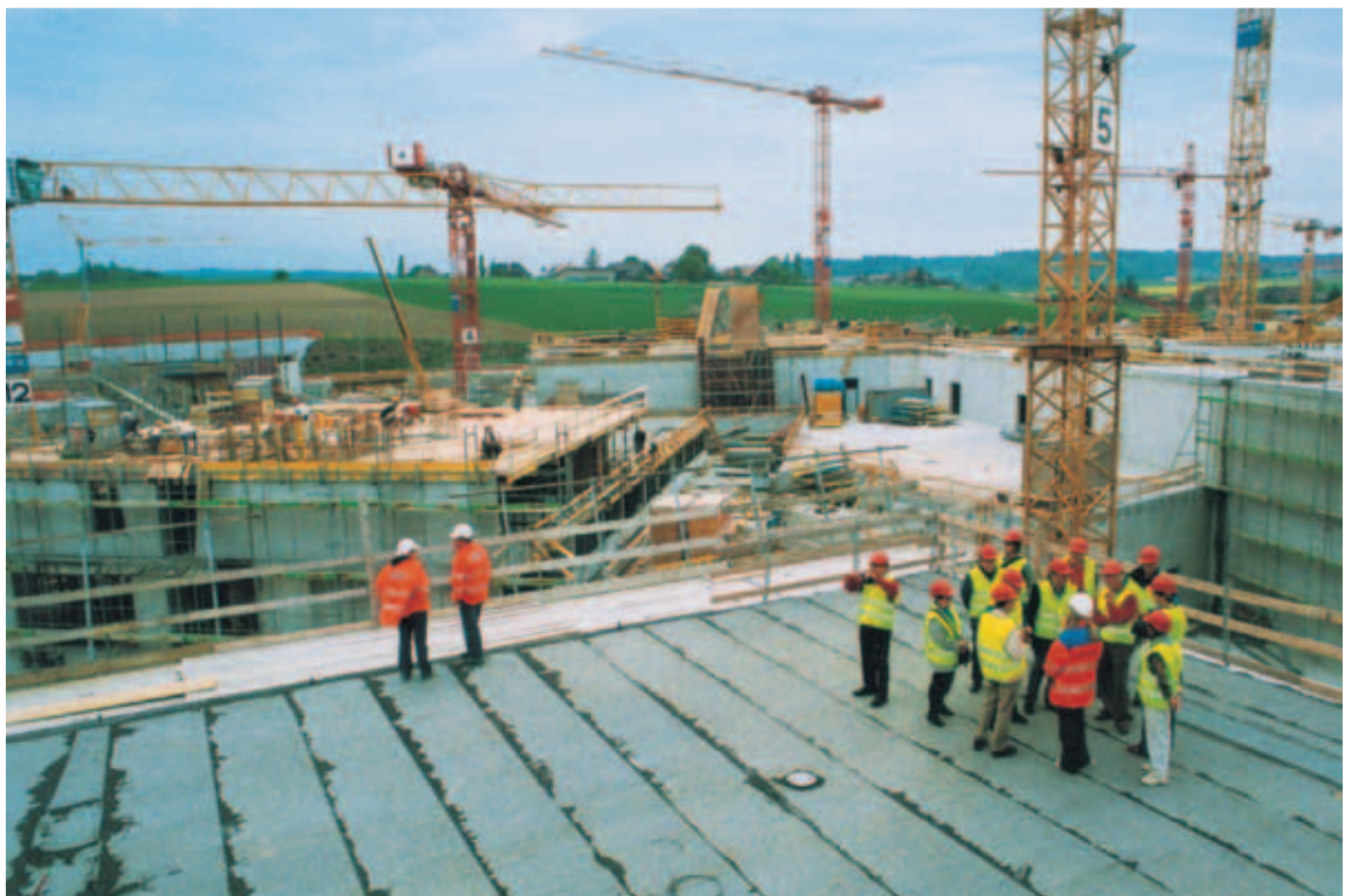
Mittendrin statt nur dabei: Die Baustellenführungen erfreuen sich grosser Beliebtheit.