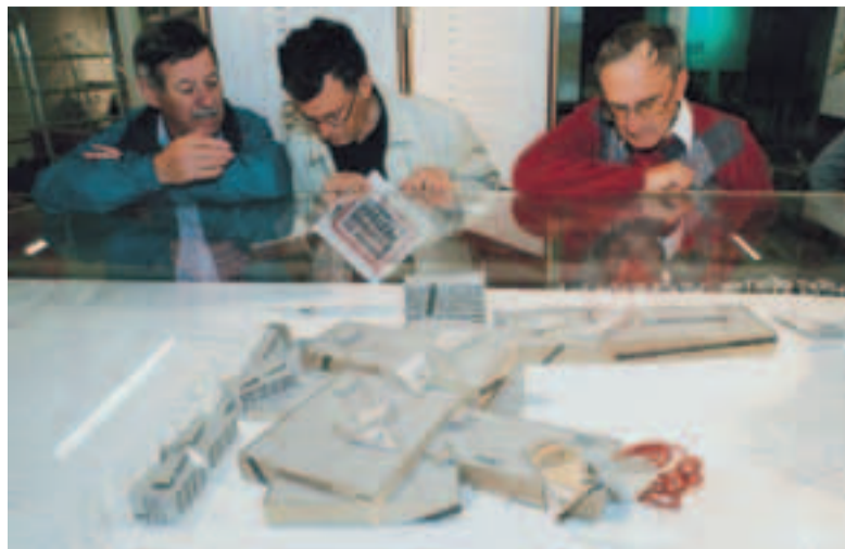
Westside-Modell im Info-Pavillon: Die Architektur von Daniel Libeskind regt zu Diskussionen an.

Eine kurze Präsentation im Info-Pavillon zeigt auf, dass die ersten Ideen einer Überbauung in Brünnen bereits 40 Jahre zurückliegen. Damals als zukunftsgerichtete Stadterweiterung gedacht, ist man heute nicht unglücklich, dass die entsprechenden Pläne aufgrund der Ölkrise nicht realisiert wurden. Fünf aneinandergereihte Satellitenstädte für total 150'000 Menschen inklusive eines Flughafens hätten gemäss den ersten Konzepten die Stadt im Westen vergrössern sollen. In der Folge wurden die Projekte immer