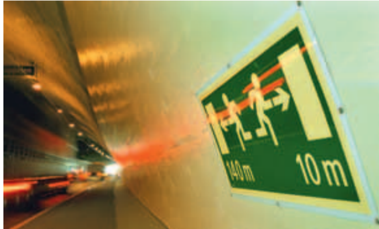
Die sicherheitstechnische Ausrüstung im neuen Brünnentunnel erfüllt höchste Standards.

Für Westside sind zurzeit rund 400 Arbeiterinnen und Arbeiter im Einsatz. Für das Freizeit- und Einkaufszentrum werden 85'000 Kubikmeter Beton, 11'000 Tonnen Stahl und 12'000 Quadratmeter Holz verbaut. Dabei gibt es Abfälle, Abgase und Lärmemissionen. Die Genossenschaft Migros Aare ist