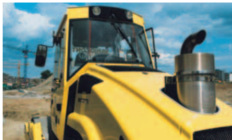
Die Baumaschinen auf der Westside-Baustelle müssen mit Partikelfiltern ausgerüstet sein.