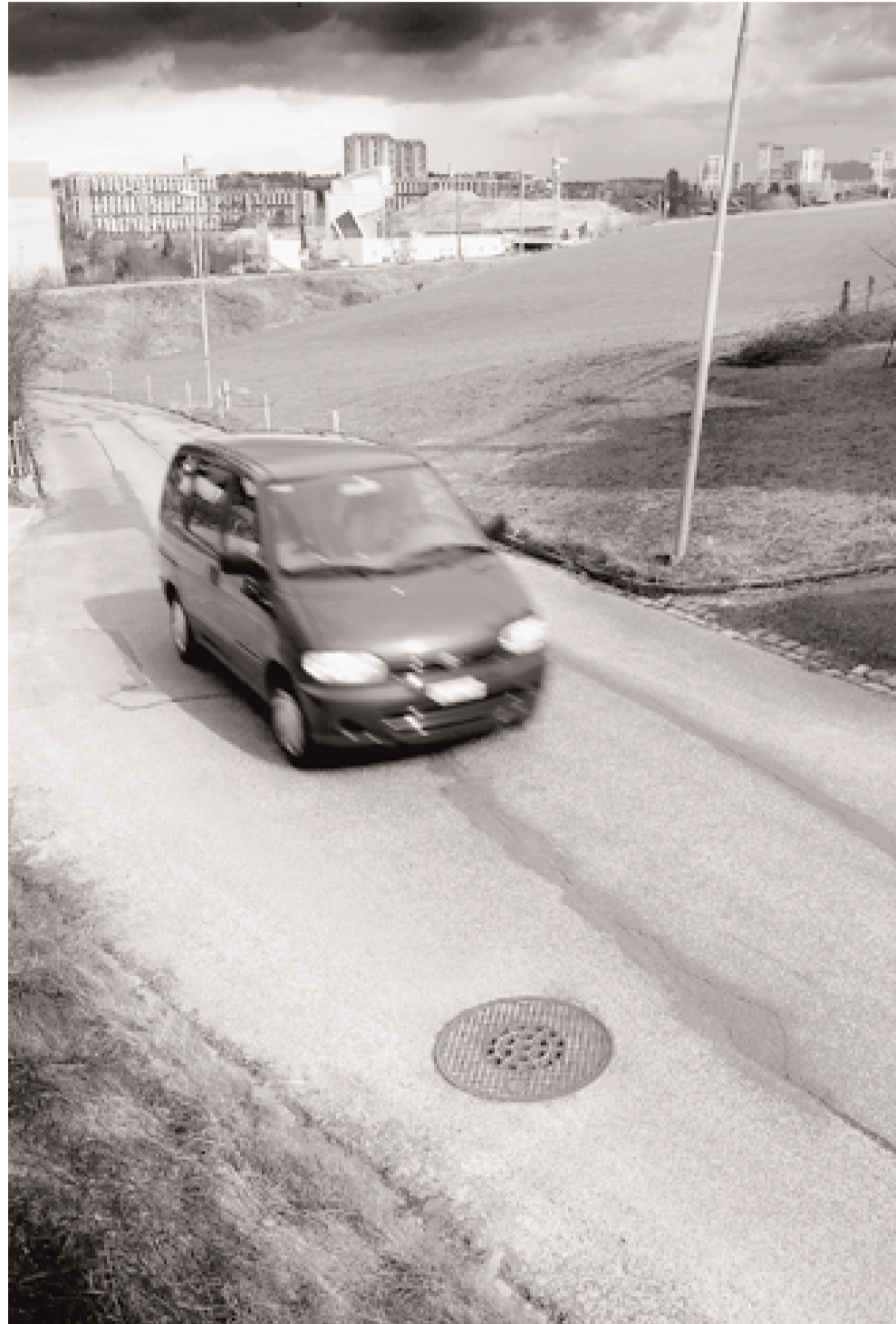
Den Bedürfnissen des künftigen Quartiers Brünnen genügt der schmale und unübersichtliche Niederbottigenweg nicht. Eine neue Umfahrung schafft Abhilfe.

Die neue Umfahrung Niederbottigen ist der zentrale Teil des städtischen Gesamtprojekts – und für die Behörden ein besonderes Bauvorhaben. Denn es komme in der Stadt Bern heute nur noch selten vor, dass eine neue Strasse auf der grünen Wiese erstellt werde, sagte Stadtgenieur Hans-Peter Wyss. 6,2 Millionen Franken kostet die 600 Meter lange Verbindung, die von der Riedbachstrasse südwärts unter den BLS-Gleisen hindurch führt und schliesslich in die Bottigenstrasse mündet. Die Umfahrung, die Westside für den Ver-