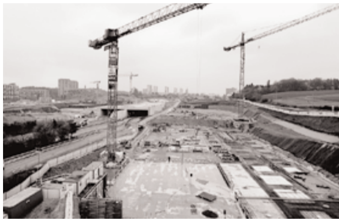
Heute ist Brünnen noch eine riesige Baugrube . . .