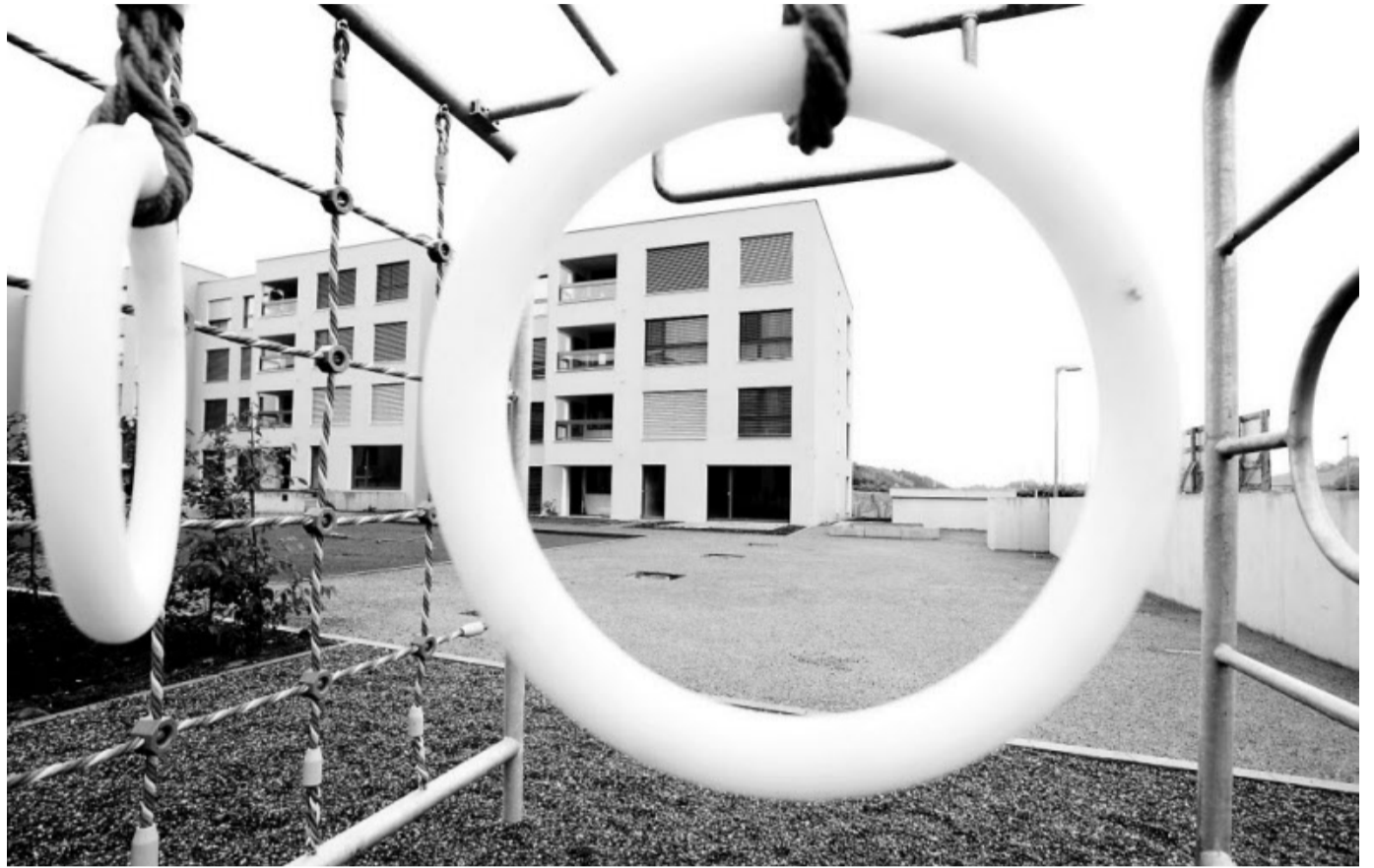
Die Ringe am Spielplatz warten auf Kinder: Blick ins neue Wohngebiet Westside in Berns Westen.

Ein Umzug wurde für Schori erst vor zwei Jahren zum Thema – aus traurigem Anlass: 2006 sei ihr Mann unerwartet an einem Herzstillstand gestorben, erzählt sie. Fast zwanzig Jahre lebte das Paar zusammen am Kappelenring in Hinterkappelen, in einer Wohnung im 13. Stock mit «traumhafter Aussicht». Die Wohnung empfand sie nach dem Tod des Gatten plötzlich als sehr gross, und die Erinnerungen an ihn waren allgegenwärtig: «Ich habe ihn überall vermisst.» Und trotz gutem und