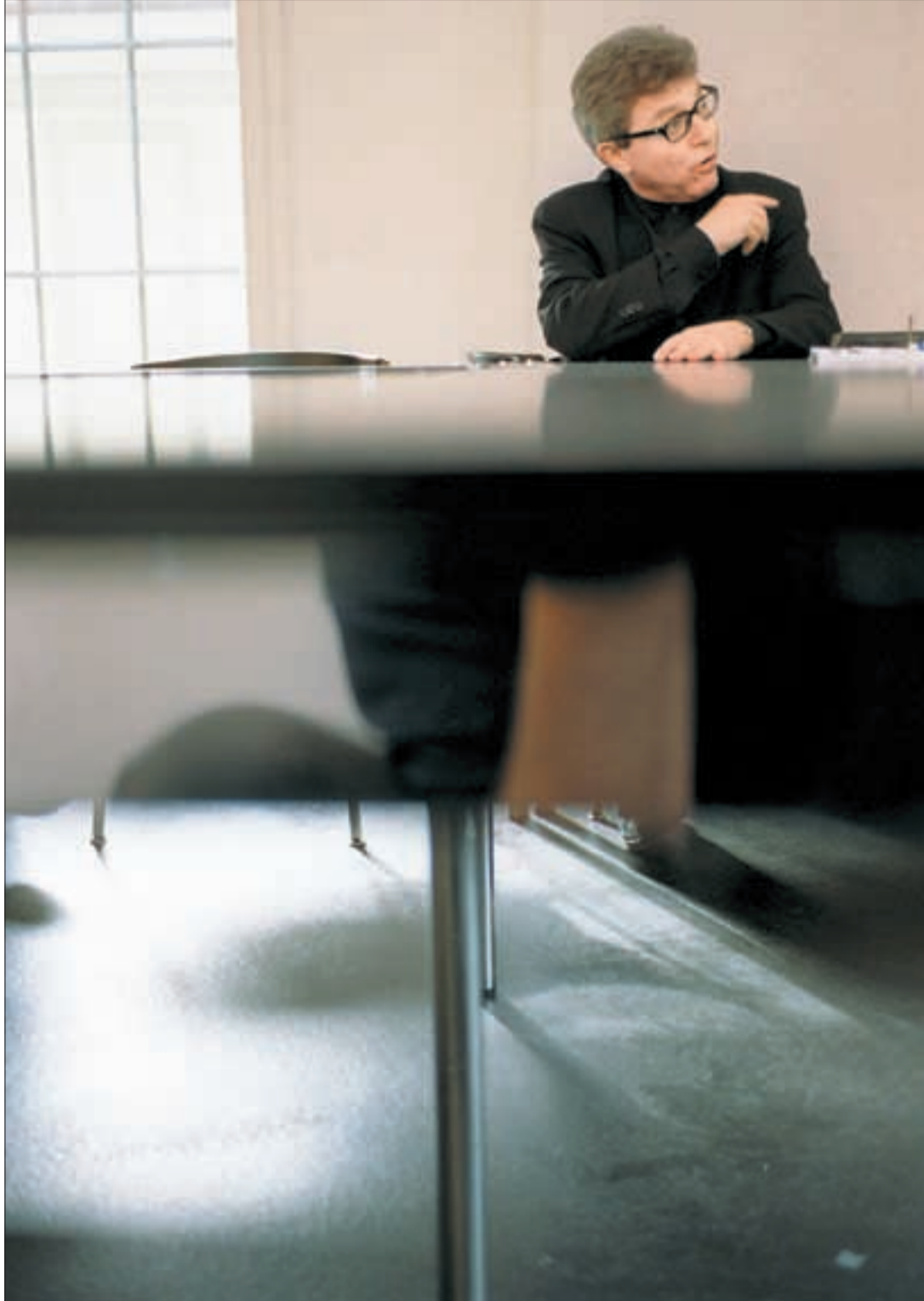
Er denkt weiträumig: Der US-Architekt Daniel Libeskind diskutiert sein Projekt für Bern vor einem grossen gesellschaftlichen und architektonischen Horizont.

Was ist das Spirituelle der Architektur? Es sind die Proportionen, es ist das Licht, es ist das Material. Das Spirituelle der Architektur ist kein Kult des Unsichtbaren. Architektur schafft in der Offenheit des Himmels einen Raum. Und Brünnen wird