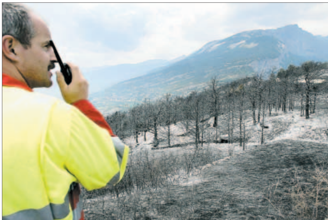
Ein Feuerwehrmitglied gibt Befehle: Gestern brachten seine Leute den verheerenden Brand im Schutzwald ob Leuk unter Kontrolle. Aber der Schaden ist immens.

Der grösste Waldbrand seit Jahren hat oberhalb von Leuk im Wallis den Schutz vor Steinschlag und Lawinen zerstört.