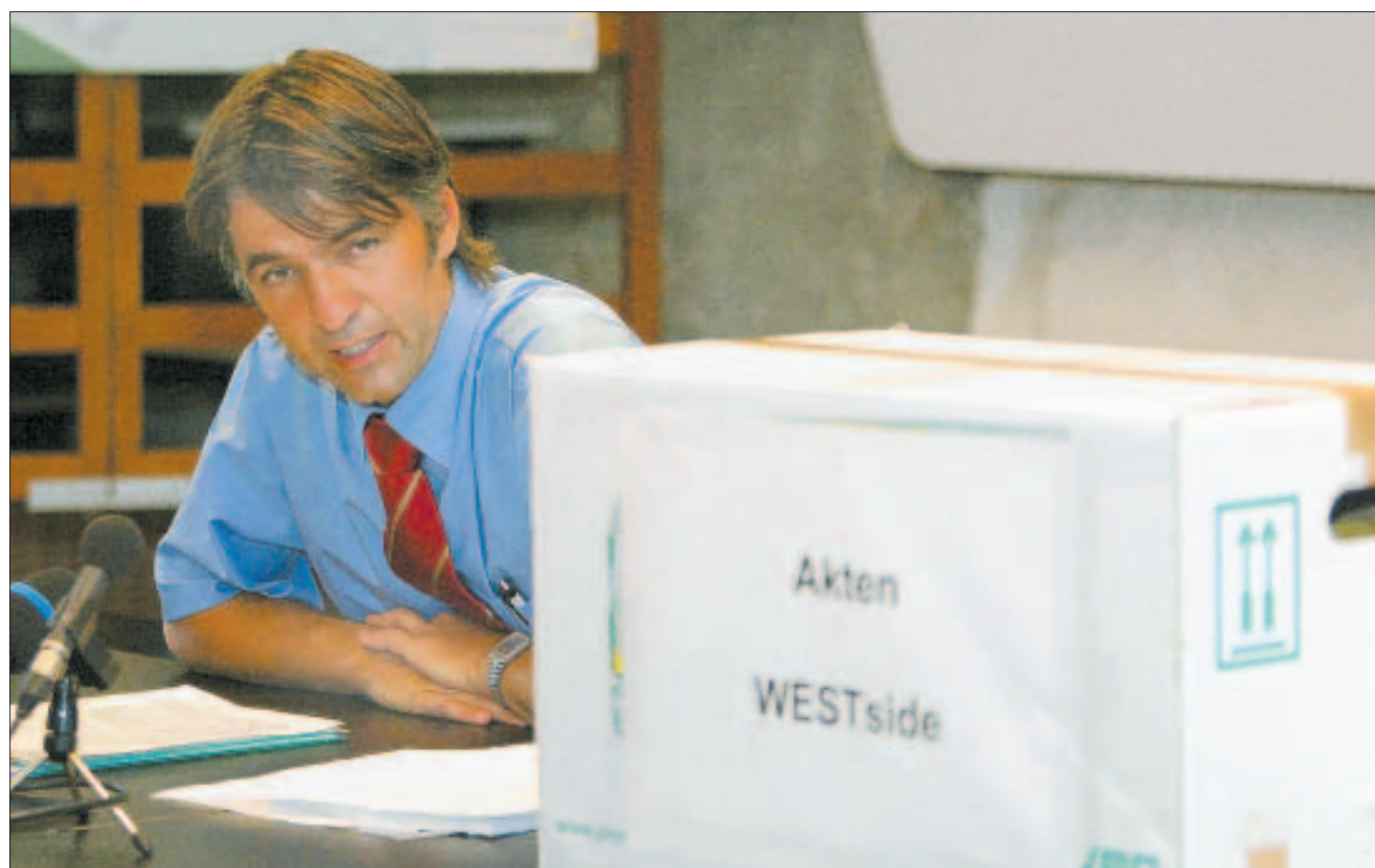
Das Bauprojekt Westside ist eine «Riesenkiste»: 230 Seiten dick ist allein die Baubewilligung für das Westside. Gemäss der Migros löst es ein Investitionsvolumen von 500 Millionen Franken aus und schafft 800 Arbeitsplätze.

Wird der Wert von täglich 6000 Fahrten in einem Zähljahr um mehr als zehn Prozent über-