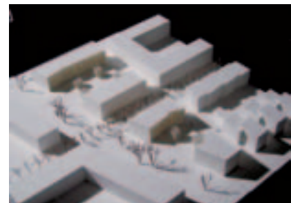
Einfach und grosszügig, mit dem Nachteil, dass auch Wohnräume nach Osten orientiert sind (2. Rang, w2-Stäuble Architekten)